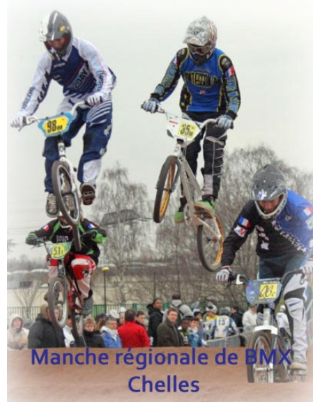
Manche régionale de BMX Chelles

D'autres événements de niveau départemental ont eu pour cadre Chelles :